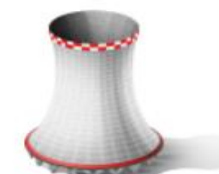
ОБЪЕКТЫ ЭНЕРГЕТИЧЕСКОГО КОМПЛЕКСА