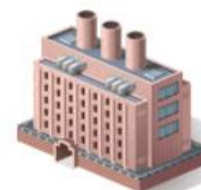
СООРУЖЕНИЯ ПРОМЫШЛЕННОГО КОМПЛЕКСА