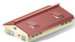
СООРУЖЕНИЯ ПИЩЕ- И АГРОПРОМЫШЛЕННОГО КОМПЛЕКСА