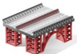
ОБЪЕКТЫ ТРАНСПОРТНОЙ ИНФРАСТРУКТУРЫ