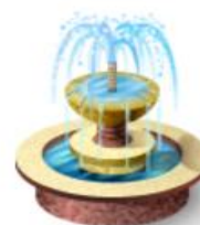
ОБЪЕКТЫ ОБЩЕГОРОДСКОГО ХОЗЯЙСТВА